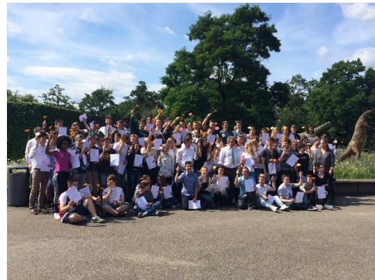
Gemeinschaftsfoto der Nachhaltigkeitstrainees Nordrhein-Westfalen

Mehr als 100 Schüler_innen nahmen im Schuljahr 2015/16 an dem Projekt „Juniorenfirmen auf dem Weg zum nachhaltigen Wirtschaften“ allein in Baden-Württemberg teil, so viele wie noch nie. Gemeinsam mit 25 Unternehmen aus Baden-Württemberg haben sie eigene Ideen für grünes